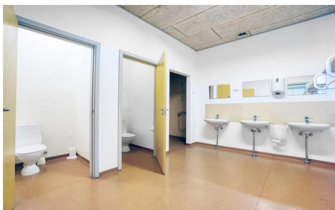
Toiletkerne med bad