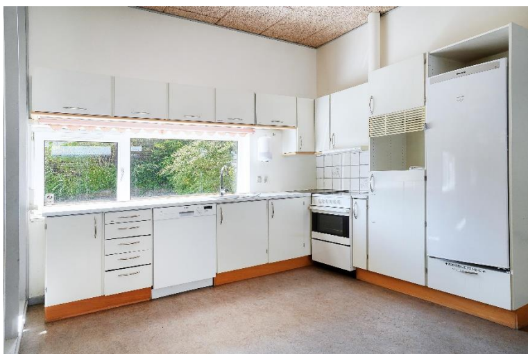
Køkkenområdet med udgang til: