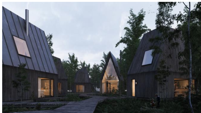
Eksempel på Tiny houses