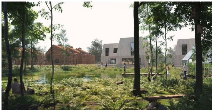
Eksempel på bebyggelse som tæt-lavt boligbyggeri

Der er udarbejdet og vedtaget tillæg til kommuneplanen.